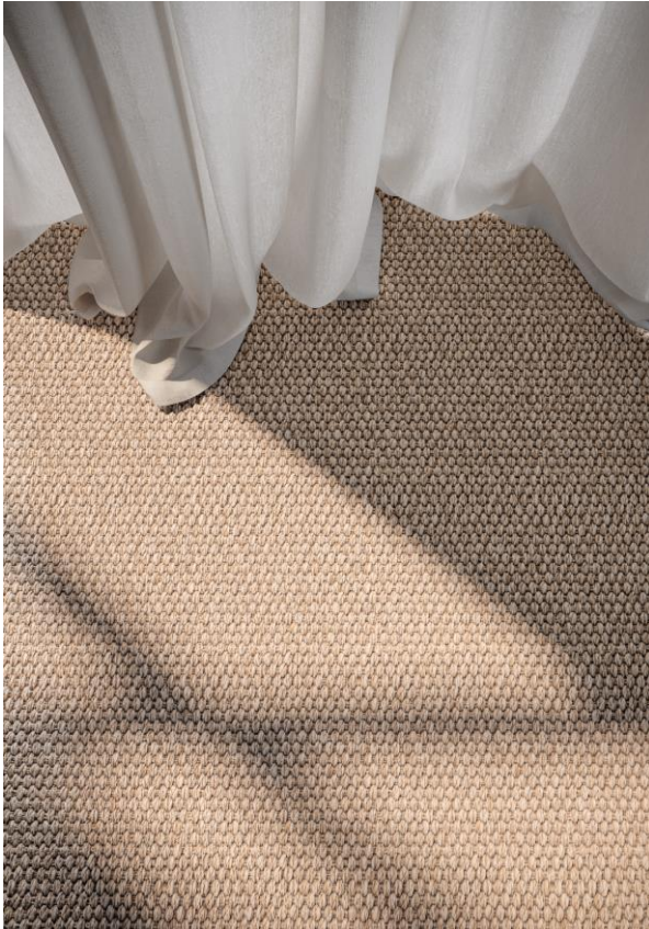
RODI TALCO Fotos: OBJECT CARPET