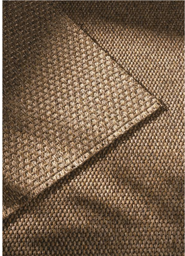
CAPRI & RODI SABBIA (Natural Border)