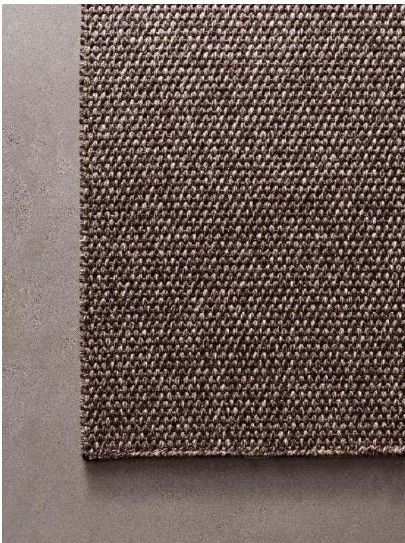
RODI VULCANO - NATURAL BORDER