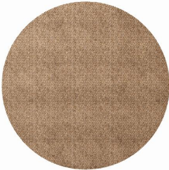
MENORCA SABBIA rund ø 2m - Freisteller