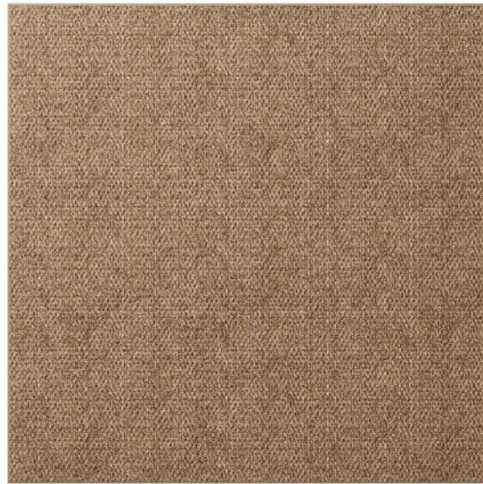
CAPRI SABBIA 2x2m – Freisteller