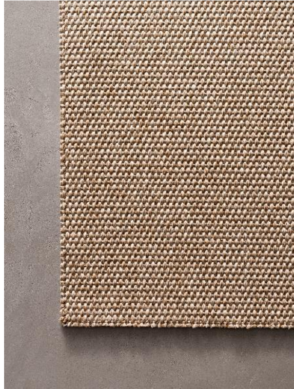
RODI TALCO – NATURAL BORDER