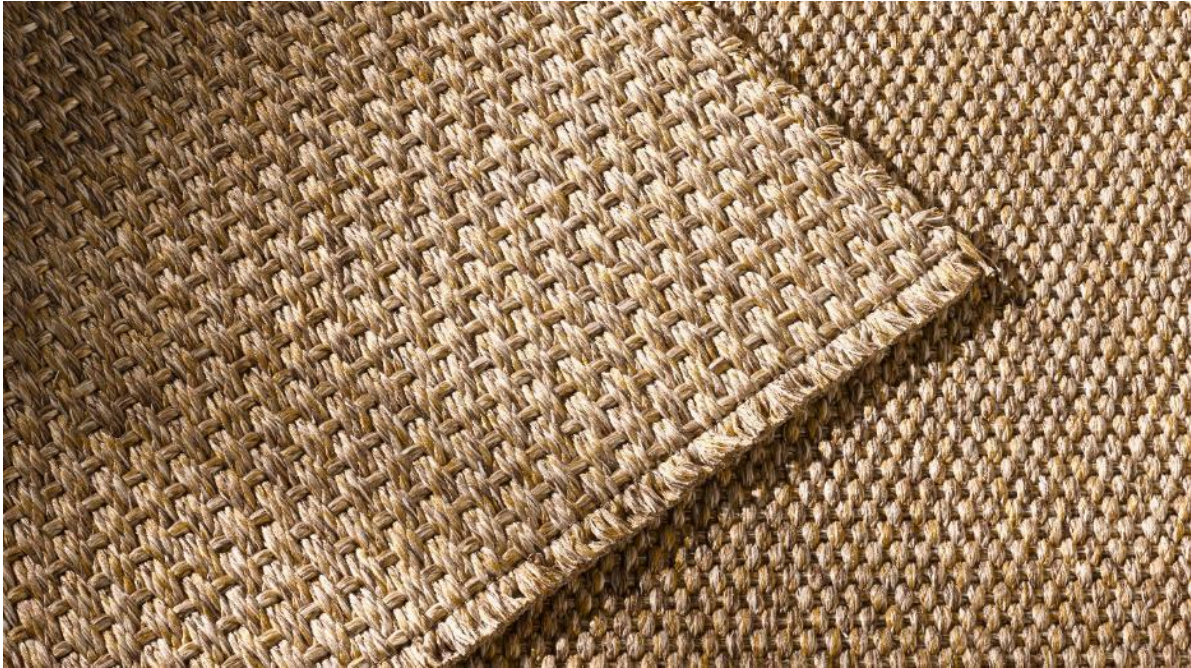
NATURAL BORDER – CAPRI und RODI, Farbe SABBIA