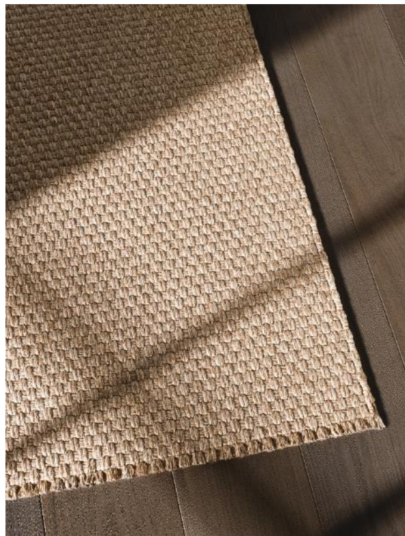
MENORCA TALCO - NATURAL BORDER