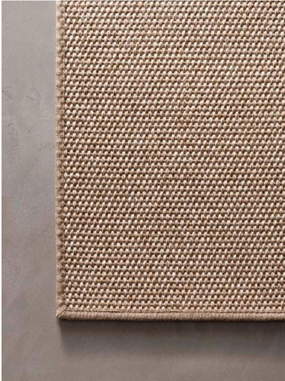
RODI TALCO – TEXTILE BORDER