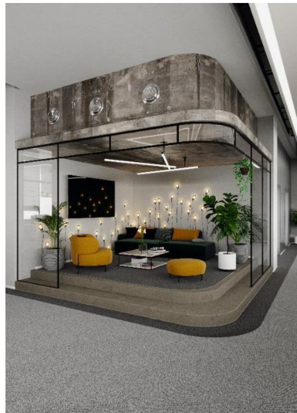
NEOO beispielhaft im Bürogebäude visualisiert. Foto: OBJECT CARPET