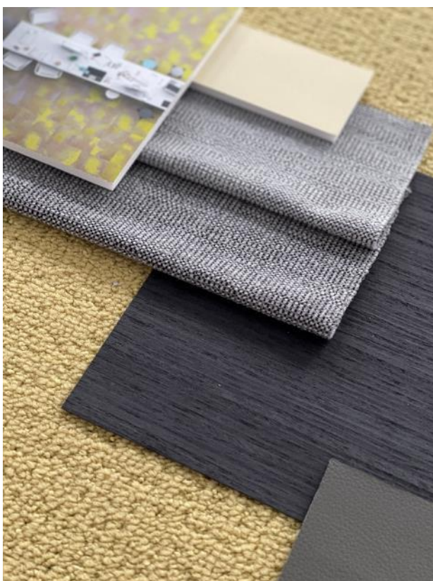
Soft Minimalism – OPEN:SPACE