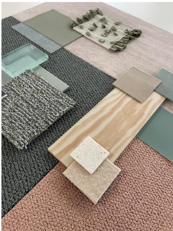
Natural Contrast – RE:GENERATE