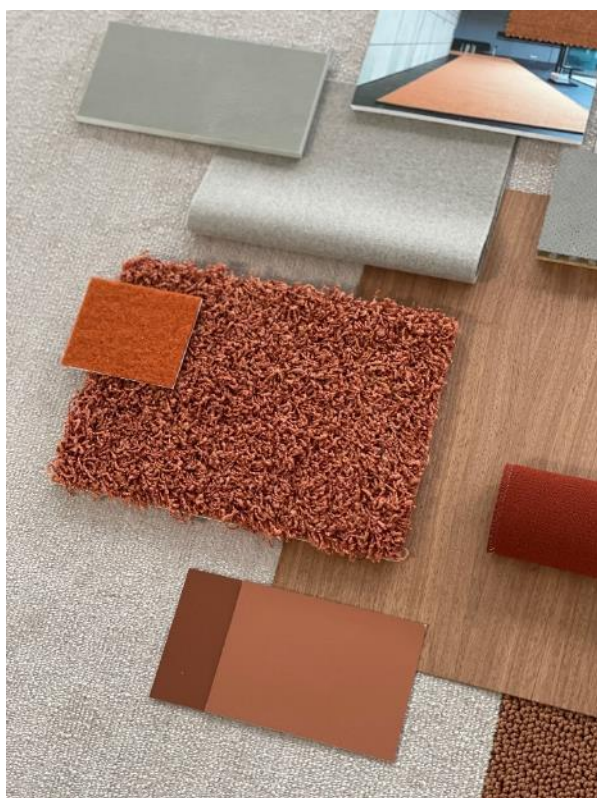
Natural Contrast – OPEN:SPACE

OBJECT CARPET GmbH Marie-Curie-Strasse 3 D-73770 Denkendorf