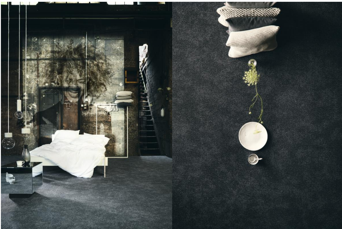
1853 und 1852 NEWCON

Das Hoch- und Tiefspiel der Schlingenkonstruktion MOVE & GROOVE erzeugt ein bewegtes Oberflächenbild. Der Teppich changiert spielerisch im Raum und ist dabei immer nahbar, vielseitig und reizvoll in seiner Wirkung.