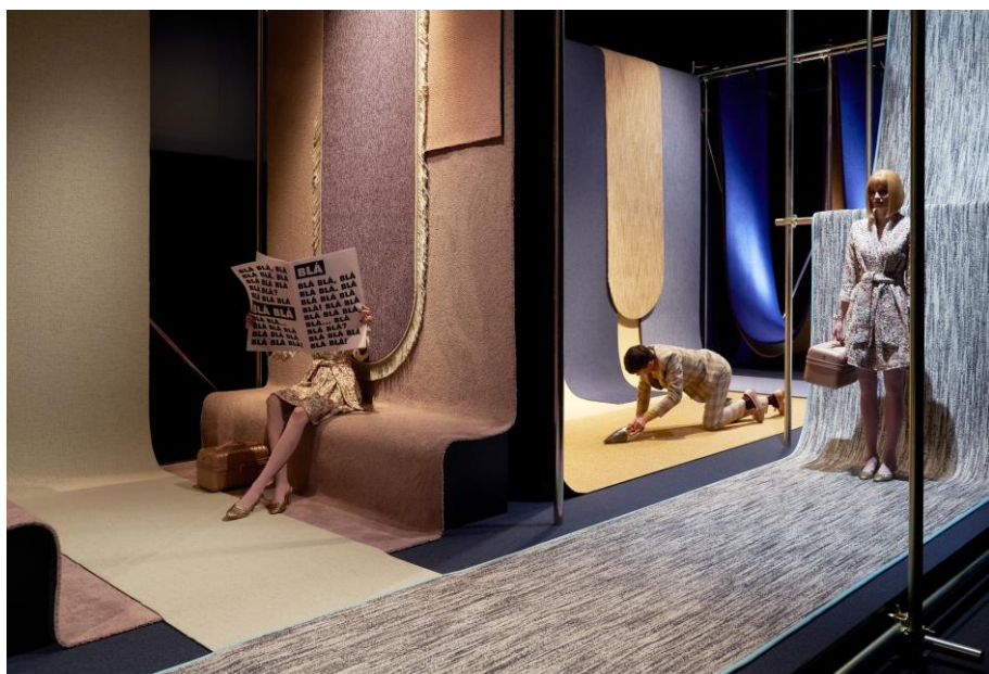
© OBJECT CARPET | Monica Menez