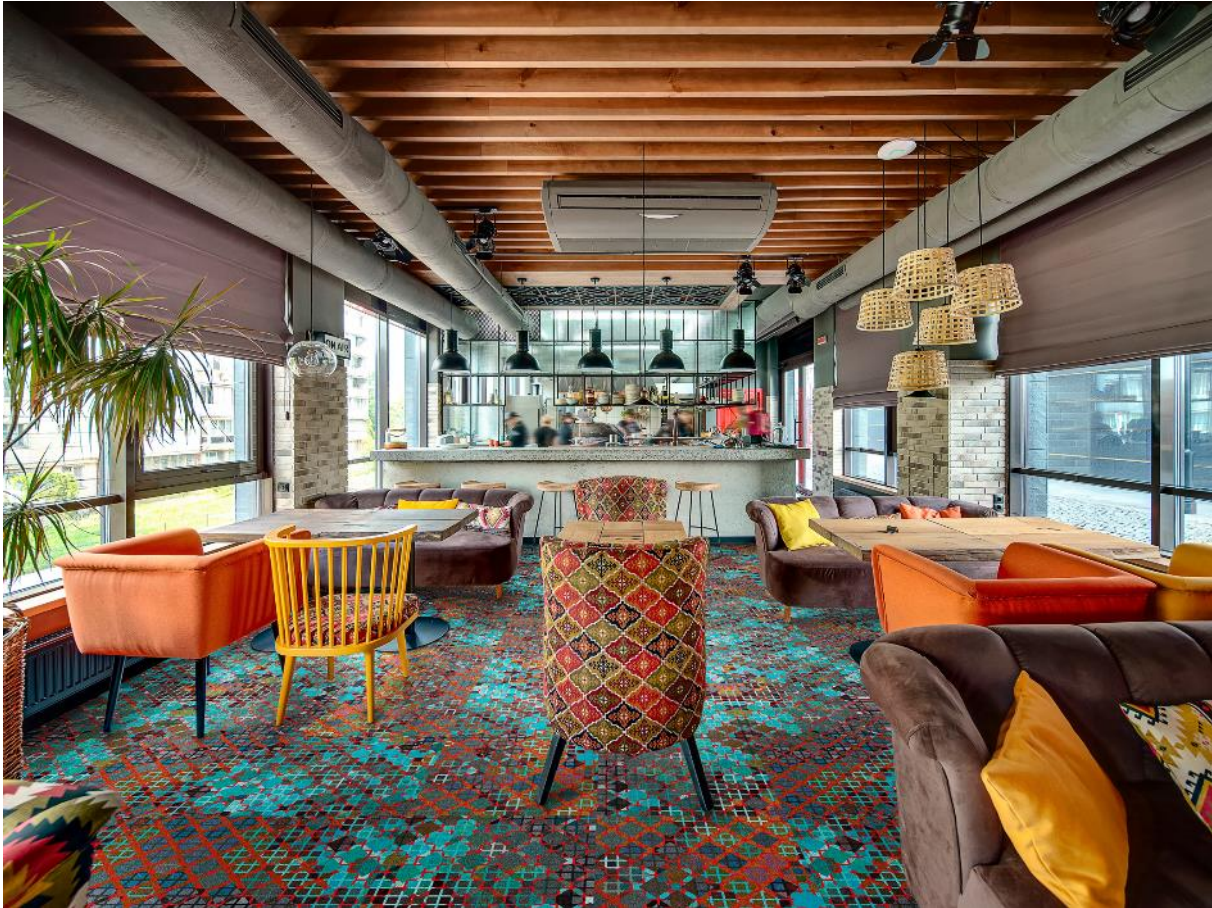
FORUM FOR GREAT IDEAS, Design Amy