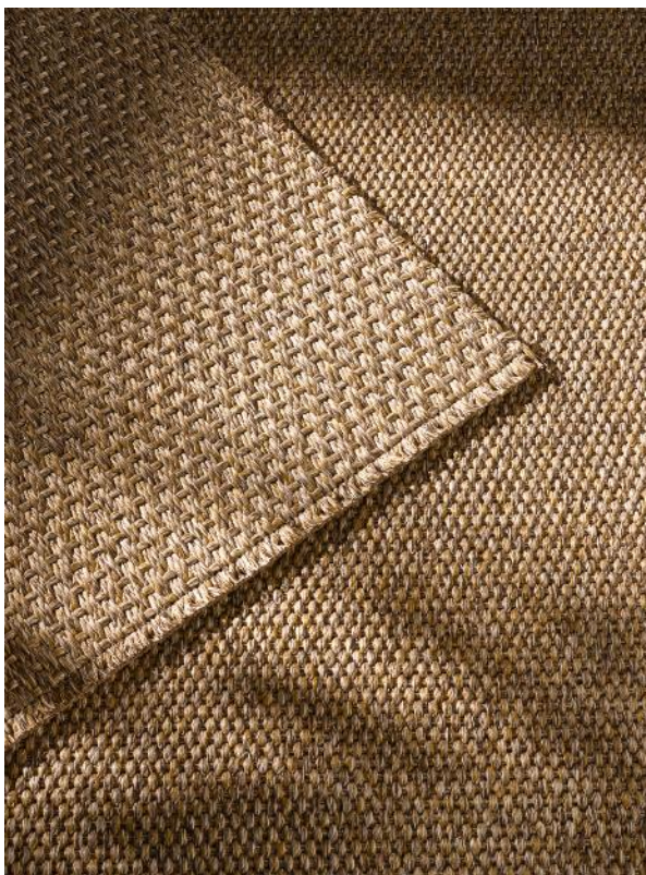
Mediterraneo Natural Border