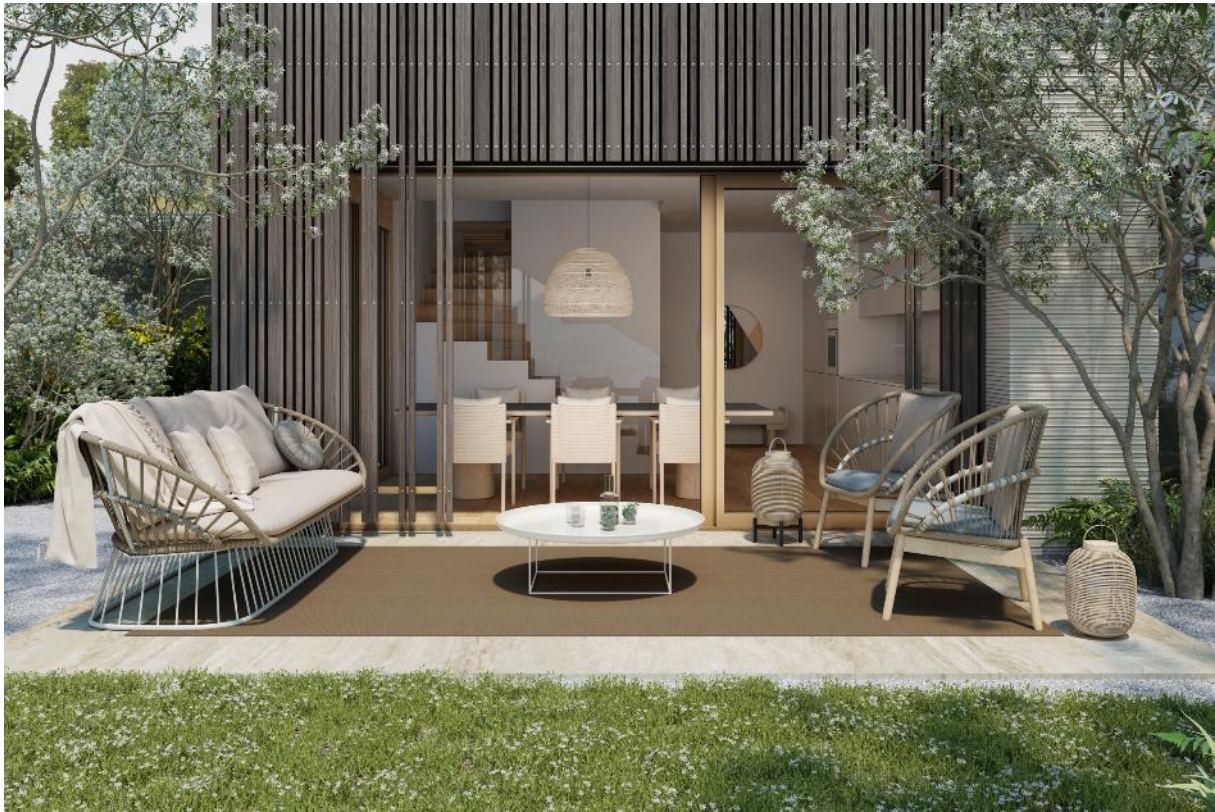
Ambiente Konfigurator, Mediterraneo Milo, Sabbia, Textile Border