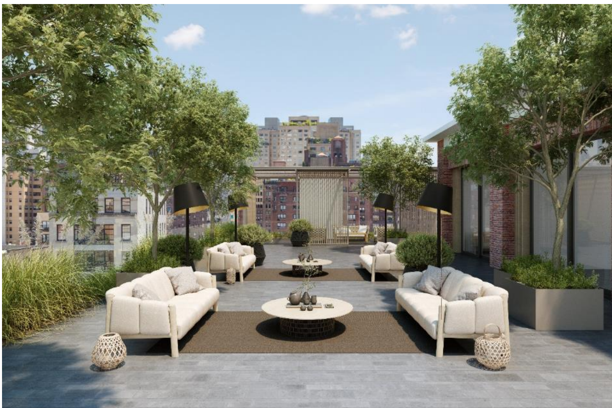
Ambiente Konfigurator, Mediterraneo Rodi, Farbe Vulcano