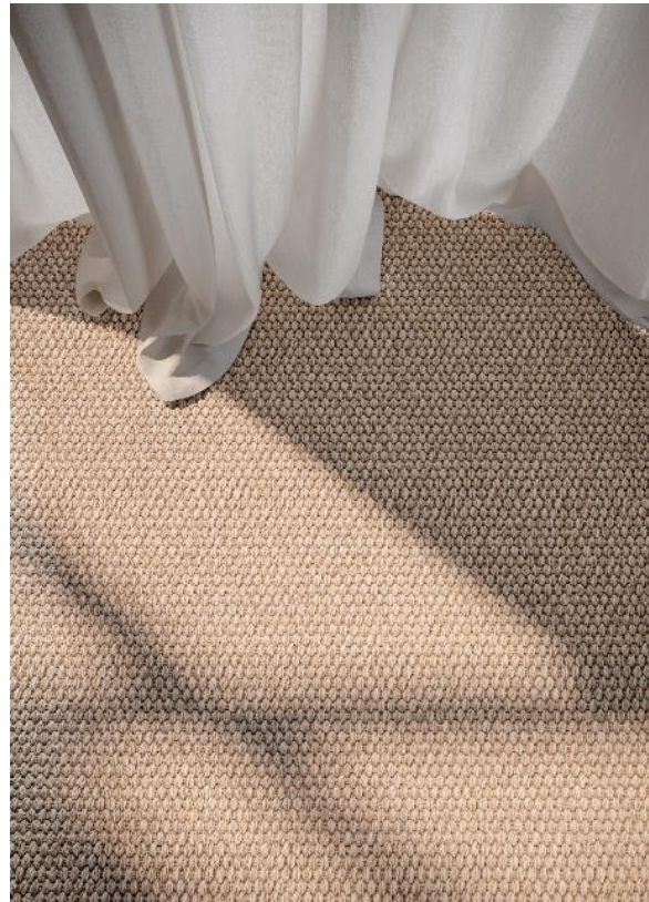
Mediterraneo RODI, Farbe Talco