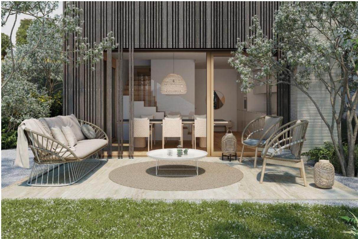
Ambiente Konfigurator, Mediterraneo Capri, Farbe Talco