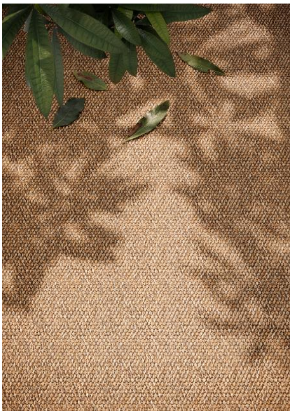
Mediterraneo RODI, Farbe Sabbia

Wer die Wirkung verschiedener Formate, Einfassungen und Farben in unterschiedlichen Atmosphären erleben möchte, kann dies ab sofort sogar online: Der Konfigurator steht fortan auch für MEDITERRANEO zur Verfügung, um die Visualisierung von Gestaltungskonzepten zu unterstützen. Erleben Sie es selbst unter www.object-carpet.com/konfigurator .